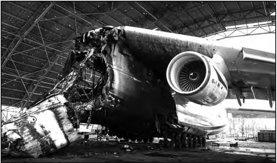
Перший та єдиний літаючий екземпляр найбільшого у світі літака АН-225 «Мрія». Внаслідок боїв за аеродром Гостомель літак згорів.

Внаслідок повітряної атаки російських військ на аеродром Гостомель під Києвом був спалений один із найбільших та найпотужніших літаків у світі українського виробництва АН-225 «Мрія» , який, можливо за злим умислом, не перегнали на аеродром у Німеччині.