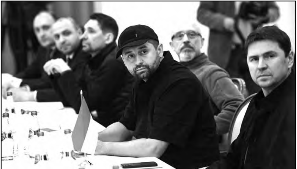
Українська делегація на перемовинах. Фото зробили журналісти російської агенції ТАРС. На перемовинах є лише російські та білоруські журналісти. Але їм російська делегація заборонила вести онлайн трансляцію. Джерело: https://forbes.ua/

Ключове питання перемовин — негайне припинення вогню та відведення військ із території України.