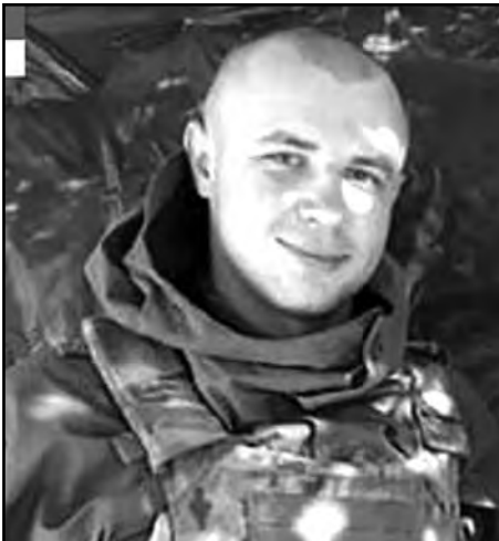
Віталій Скакун — перший Герой України з початку повномасштабної агресії РФ.

Щоб ворог не прорвався до Києва, українські захисники підривають мости. На трасі Київ-Житомир підірвали міст біля села Стоянка.