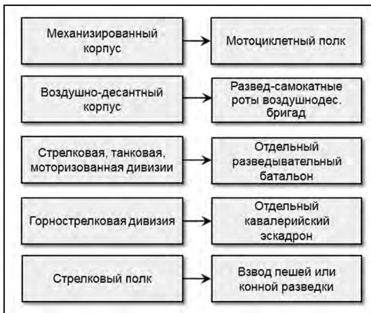
Силы и средства войсковой разведки до начала войны

...Несмотря на то, что группировки войск фашистской Германии, готовившиеся к нападению на СССР, военной разведкой были вскрыты и доведены до командований приграничных военных округов, собственно разведка, как и войска военных округов, 22 июня 1941 года оказались неподготовленными к работе в условиях войны. Поэтому с ее началом пришлось действовать