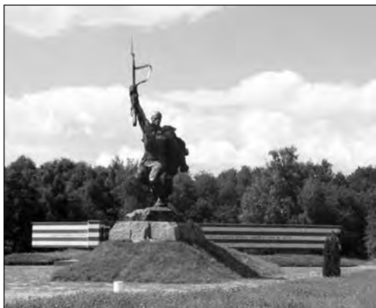
Мемориал и братская могила бойцов и командиров Юго-Западного фронта, павших 20 сентября 1941 г. Урочище Шумейково, Полтавская область

...Никакими конкретными данными о количестве и составе вторгшихся на нашу землю вражеских войск, о направлении их главного удара наш разведчик пока не располагал. Поэтому обстоятельных выводов о намерениях противника сделать было невозможно». 1