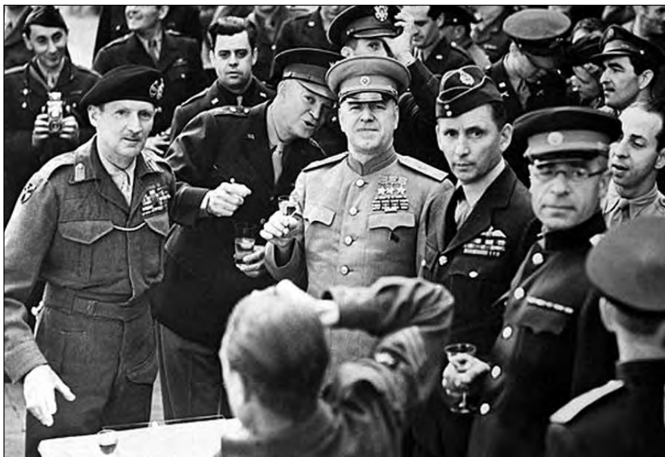
Маршал Жуков награждает фельдмаршала Монтгомери и генерала Эйзенхауэра орденами «Победа». Справа налево: А. Ф. Васильев, А. У. Теддер, Г. К. Жуков, Д. Эйзенхауэр, Б. Монтгомери. 5 июня 1945 г.

«...принимал непосредственное участие в оперативном руководстве соединениями левого крыла 9-й армии во время боев под Гизель. В своей работе т. Васильев показал себя храбрым, волевым, инициативным штабным командиром и в сложной оперативно-тактической обстановке принимал правильные решения, оказывая вовремя помощь войскам в улучшении их