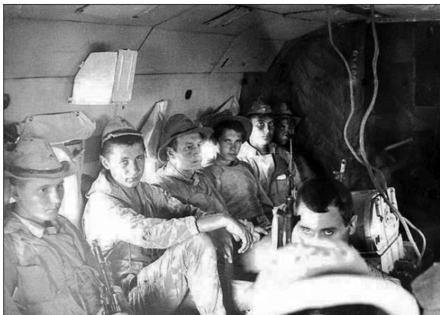
Десант в неизвестность

Считаю, что организация взаимодействия в десанте — самое основное. Там должно быть все расписано по минутам, каждый должен четко знать и уметь выполнять свои обязанности. Ведь некогда, да и невозможно в ходе высадки рассказывать что, кому и как делать. Кроме того, необходимо расписать личный состав, вооружение, боеприпасы по вертолетам, рейсам, пунктам посадки и высадки. А то получится, солдаты в одном вертолете, командиры в другом, минометы выгрузят, а мин к ним нет, и так далее. Необходимо поставить конкретную задачу каждой роте, взводу, отделению. После высадки из вертолетов, все должны немедленно выполнять задачу, причем высадка может происходить и под огнем душманов.