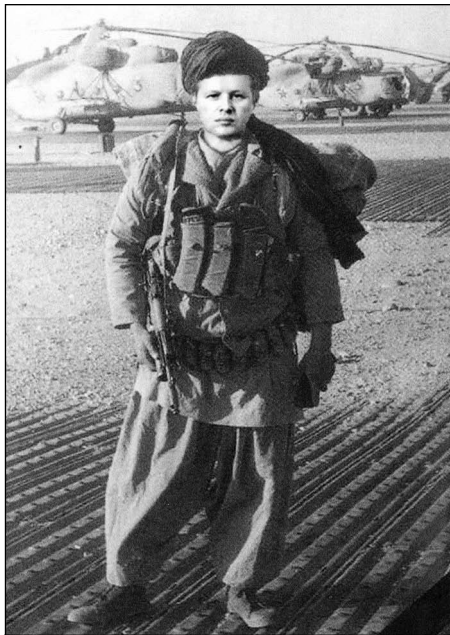
Аэродром Кундуз, осень 1983 г.

Поэтому, весь день ушел на организацию взаимодействия с авиаторами, постановку задач своим, приданным и поддерживающим подразделениям. Провели смотр, после которого я доложил комдиву о готовности десанта.