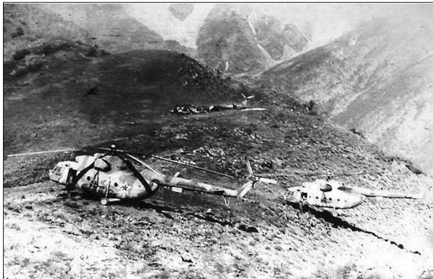
Злополучное место высадки (с ошибкой на 17 км от расчетной) и ход самой высадки десанта. На дальнем плане сбитый МИ-8. (Снимок сделан летчиками 254 овэ 17.06.1986 г.)

вытащить. Тогда я запустил руку в бак и нащупал на дне какой-то предмет. Хотел его вытащить – но тут взрыв!»