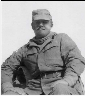
Уезд Андараб. Весна 1984 г.

да и к разведке никакого отношения не имел. Может, и принимал участие в каких-то боевых действиях, поскольку награжден орденом Красной Звезды, но только в самых заурядных. Да и орден-то получил потому, что был ранен осколком снаряда своей же артиллерии.