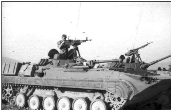
Афганское изобретение — БРМ-1К с трофейным ДШК.

во время боя, они упали на дорогу и их несколько раз переехали, так что для показа в ХАД (афганской госбезопасности) они явно не годились. Так мы и приехали в гарнизон: на одной БМП сидят солдаты, человек 15, на другой — два пленных «духа», проводники и несколько человек наших, на тресе — задом наперед подбитая БМП.