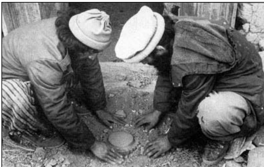
«Умельцы» за работой