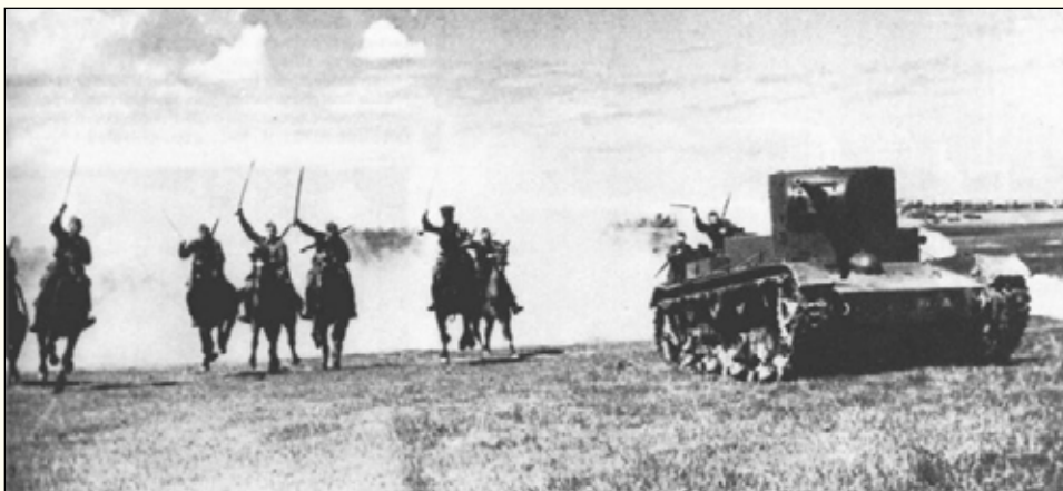
Атака кавалеристов при поддержке Т-26

Могла ли такая группа «оперативно-подвижно» действовать в тылу противника, прорывать оборону, совершать обходы и охваты и завершать разгром окруженного противника в глубине его обороны?