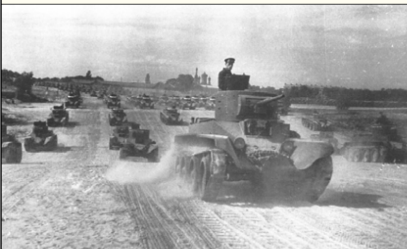
Мехкорпус на марше