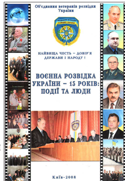
Книга «Военная разведка Украины — 15 лет: события и люди»

В 2008 году вышла книга «Военная разведка Украины — 15 лет; события и люди», где тоже описываются события первого года существования украинской военной разведки.