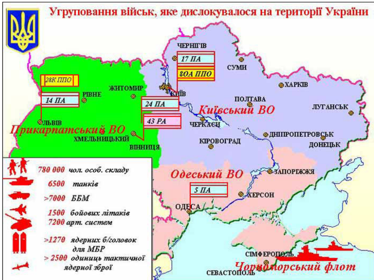
Групировка войск, дислоцировавшихся на территории Украины