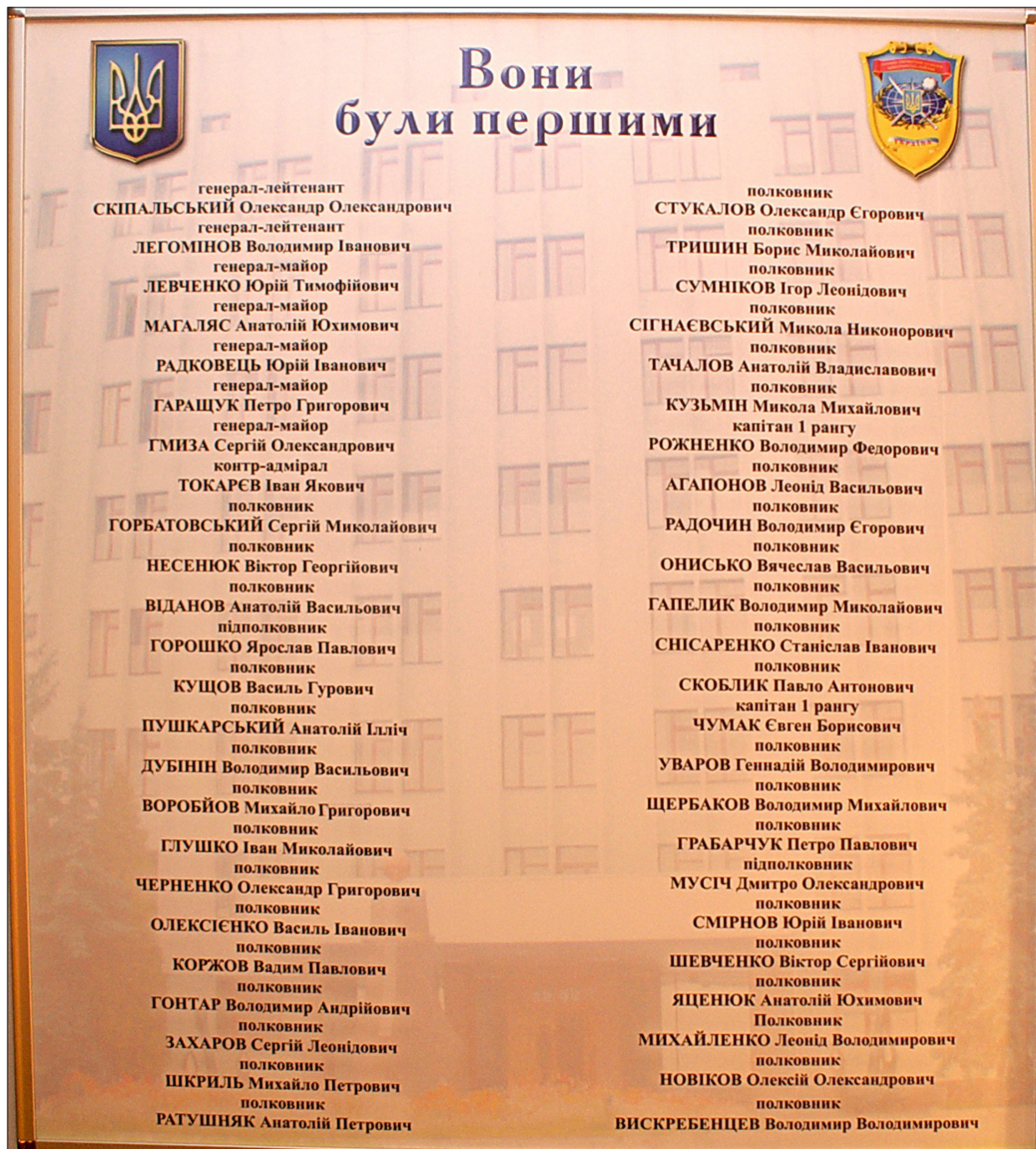
Стенд «Они были первыми» в музее ГУР МО Украины

Сейчас, оглядываюсь назад на 20 лет, вижу какой большой и сложный путь проделала разведка Украины. А начиналась она с части, которая именуется сейчас Департаментом разведывательного обеспечения ГШ ВСУ. Пожелаем же в день рождения ему, прямому наследнику Управления разведки и РЭБ Главного штаба ВСУ, успехов в работе, а его коллективу — доброго здоровья и счастья в жизни!