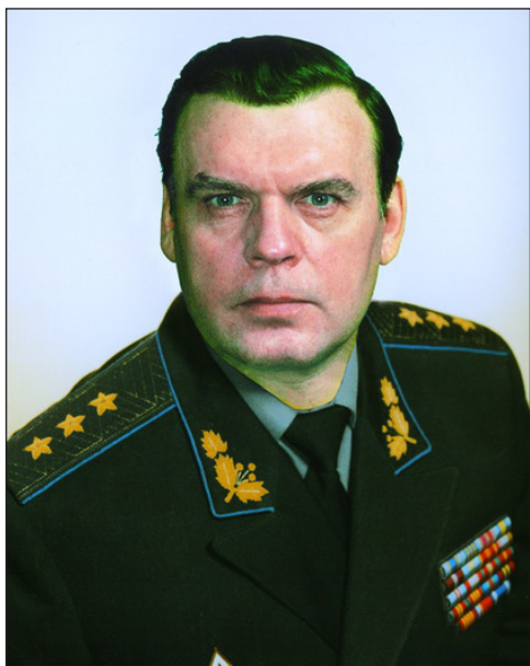
Генерал-полковник К. Морозов, Министр обороны Украины

Нас, первых 103 офицеров и генералов ВС Украины, собрали в Конференц-зале штаба КВО, и мы там приняли Военную присягу. До нас, ее принял только Министр обороны генерал Морозов К. П. на заседании Верховной Рады 6 декабря 1991 года, когда утверждался ее текст.