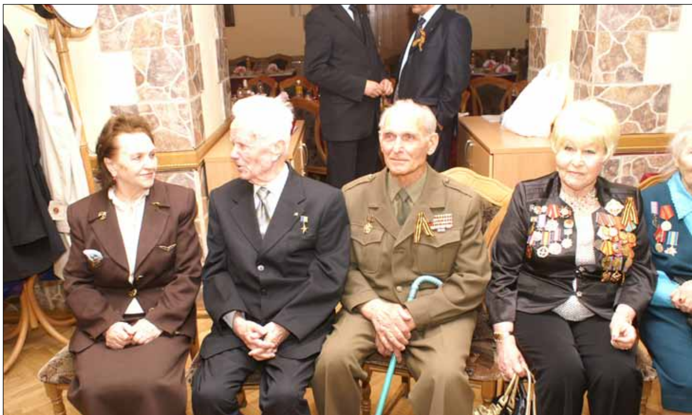
Фонд ветеранов военной разведки, ветераны, гости Фонда на чествовании ветеранов войны в День Победы.