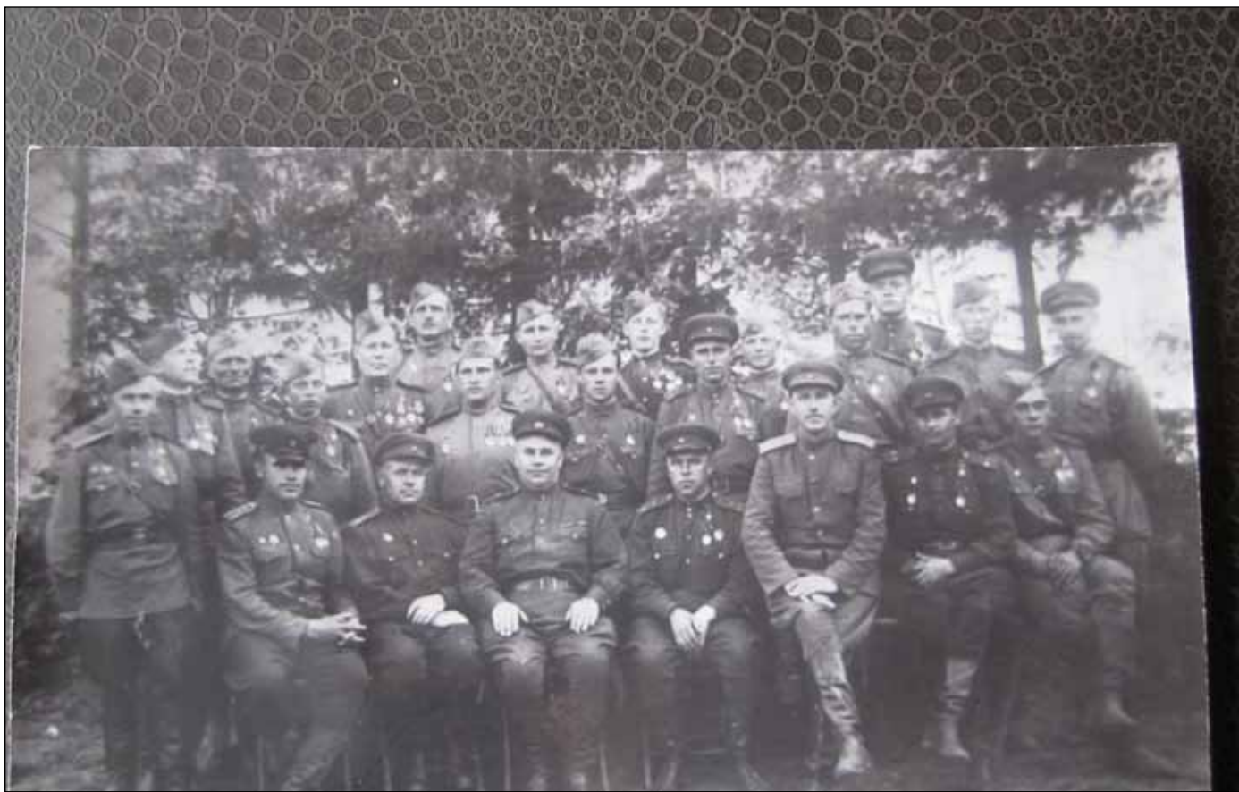
Разведчики 167-й стрелковой дивизии

дневное наблюдение за противником в его тылу с района высоты 715, где точно изучил систему обороны противника, наличие и расположение артиллерии и движение войск и техники в прифронтовом районе.