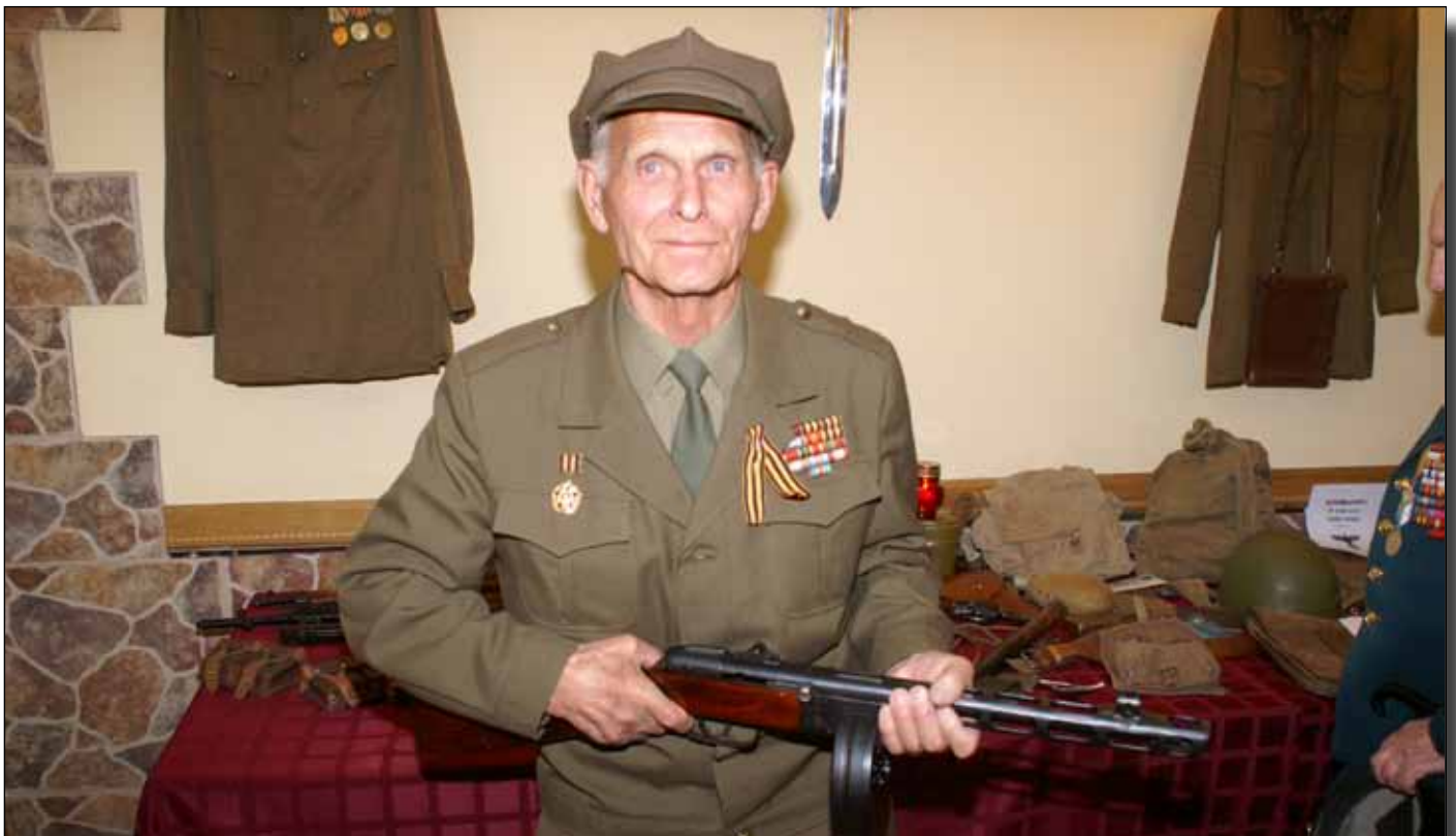
А руки-то помнят...