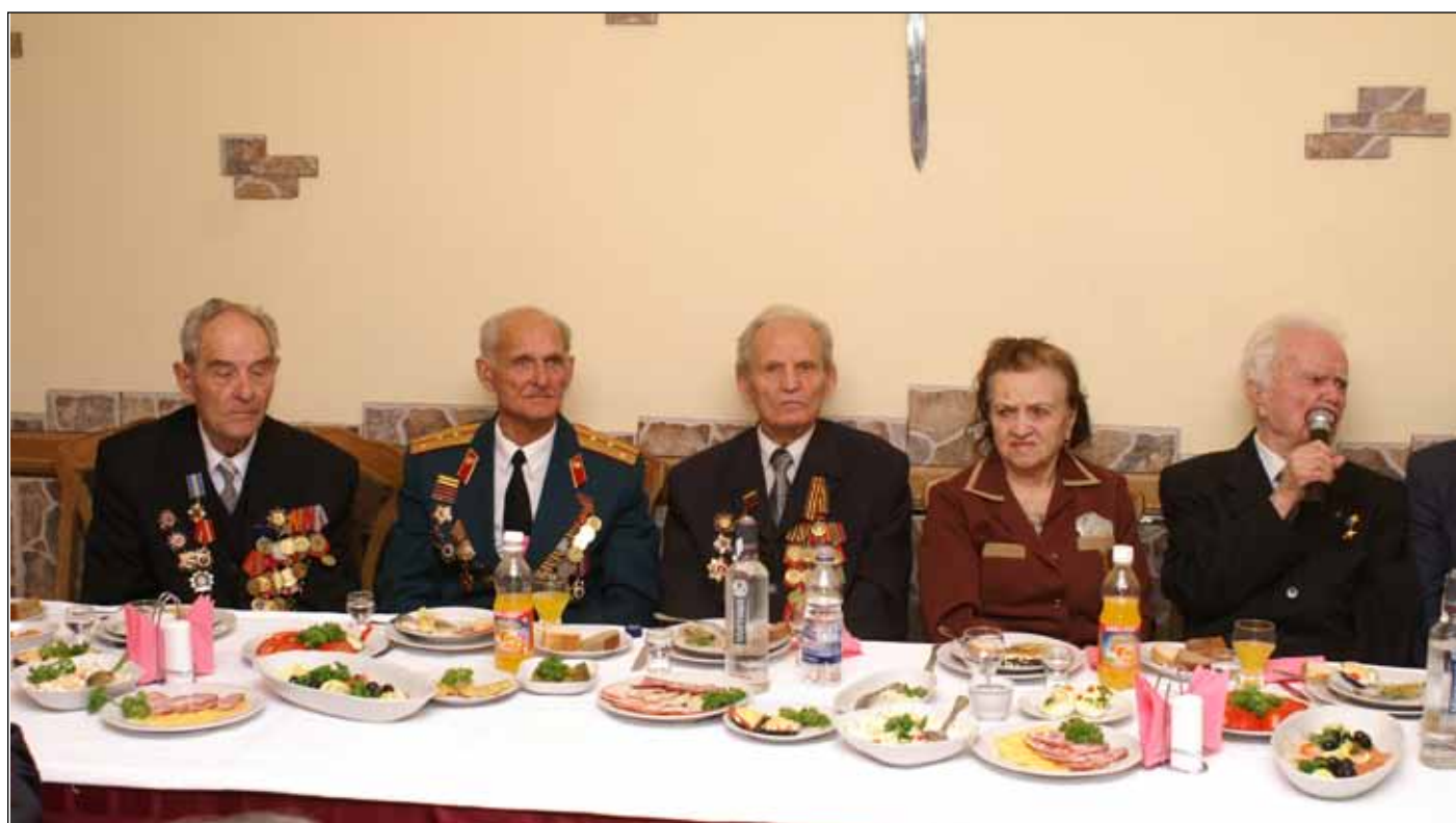
Ветераны за праздничным столом