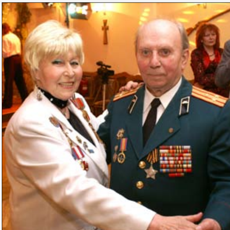
Не стареют душой ветераны... Чествование ветеранов войны на 65-летие Победы. Киев, 2011 г.