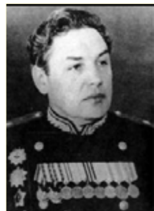
Член Военного совета 4 гв. армии генерал-майор Д. Т. Шепилов