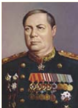
Командующий войсками 3-го Укр. фронта Маршал Советского Союза Ф. И. Толбухин