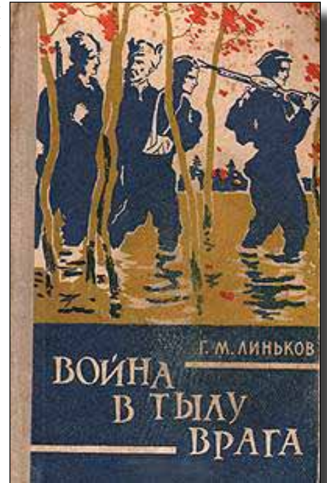
Книга Г. М. Линькова «Война в тылу врага»

Умер Г. М. Линьков в 1961 году (трагически погиб на охоте 17 декабря), похоронен на Новодевичьем кладбище Москвы.