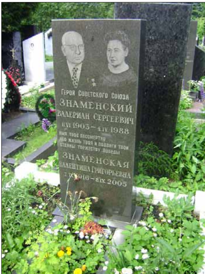
Надгробный памятник Знаменских на Кунцевском кладбище, Москва

Знаменского Валериана Сергеевича по праву считают одним из отцов-основателей спецназа ГРУ.