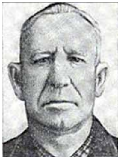
Знаменский В. С.

Герой Советского Союза (Указ от 07.05.1940 г., медаль № 455)