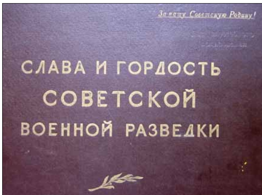
Альбом «Слава и гордость советской военной разведки». Издание ГРУ ГШ СССР, 1967 г.

Имя и подвиг Героя Советского Союза Григория Матвеевича Линькова, как и Героя Советского Союза Василия Васильевича Щербинны (следующего разведчика, упомянутого Знаменским в его письме), запечатлены в альбоме «Слава и гордость советской военной разведки», изданном ГРУ ГШ ВС СССР в 1967 году.