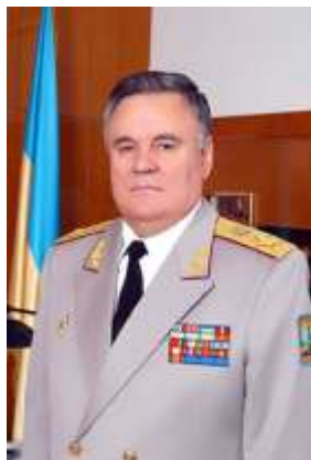
Начальник НАОУ генерал армії України Радецький В.Г.

Третій етап розвитку кафедри пов'язаний з кардинальними змінами підходів до підготовки кадрів у Збройних Силах України, переходом академії на однорічний термін навчання слухачів та запровадженням системи курсової підготовки офіцерів.