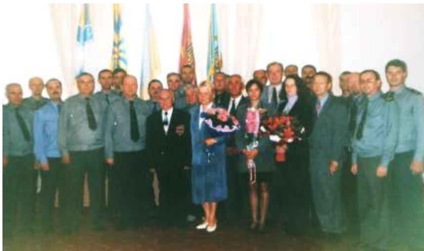
Кафедра розвідки 2001 року