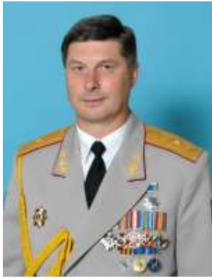
Генерал-майор Левченко О.В.— начальник кафедри розвідки (2003-08 рр.)