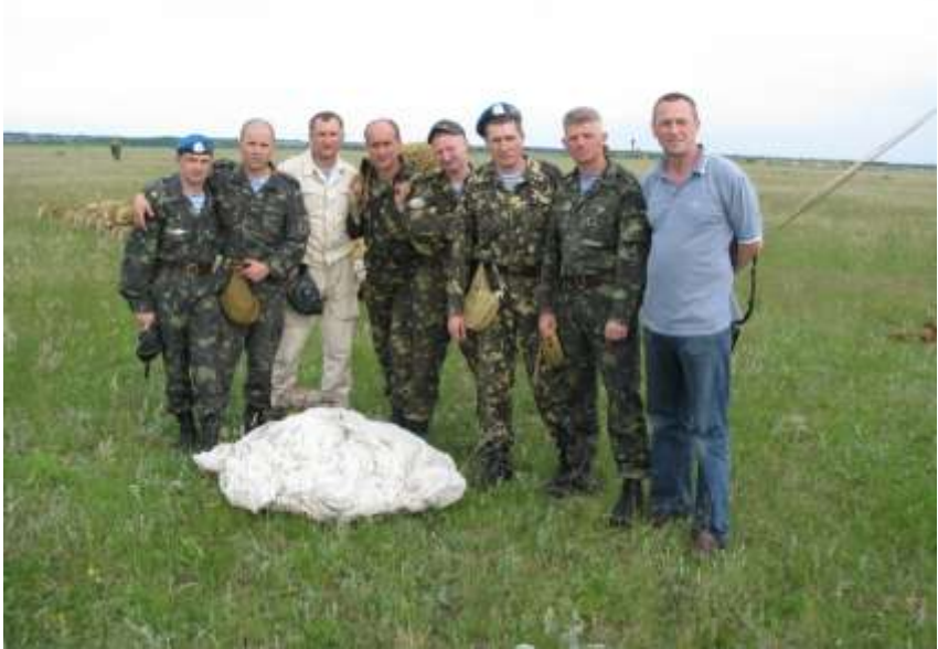
Офіцери кафедри розвідки та слухачі-десантники під час виконання програми стрибків (травень 2010 року)

Самовіддана, наполеглива і плідна праця колективу кафедри розвідки неодноразово заохочувалась керівництвом академії і ГУР МО України. Кафедра по праву вважається однією з провідних у Національній академії оборони України. Та й як може бути інакше в колективі де над загальною справою пліч о пліч працюють батьки й сини, а традиції передаються з покоління в покоління і шануються від ад'юнктів до начальників кафедри включно.