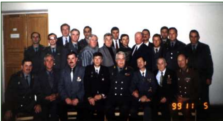
Кафедра розвідки 1999 року

Викладачі, поряд із проведенням занять, розробляли нові лекції, навчальні посібники, командно-штабні навчання, уточнювали та коригували навчальні програми і тематичні плани.