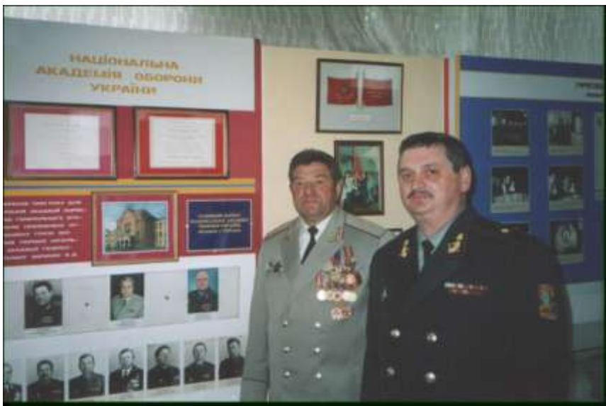
Перший начальник академії, перший начальник кафедри

вересня 1994 року розпочала підготовку фахівців-розвідників з вищою військовою освітою для Збройних Сил України.