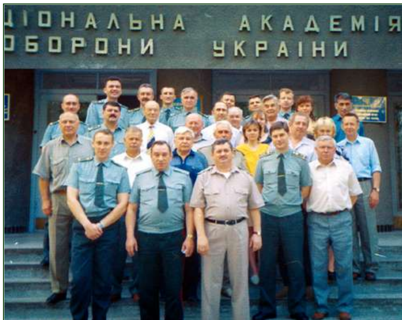
Кафедра розвідки 2003 року