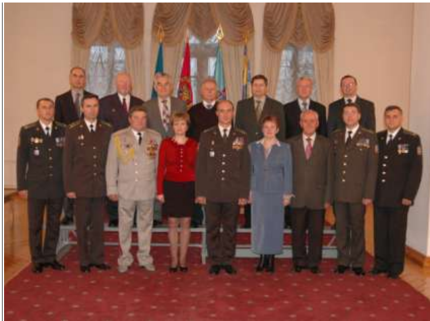
Кафедра розвідки з 2008 року