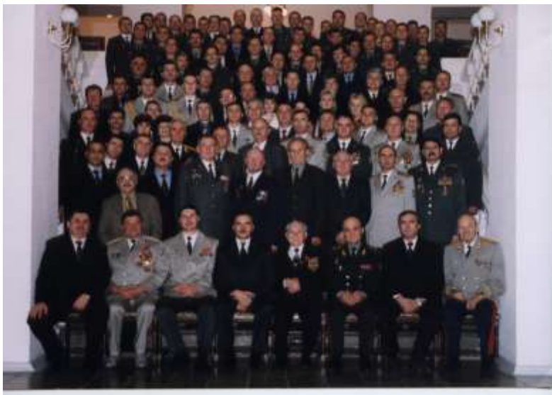
10-річчя кафедри. Листопад 2003 року