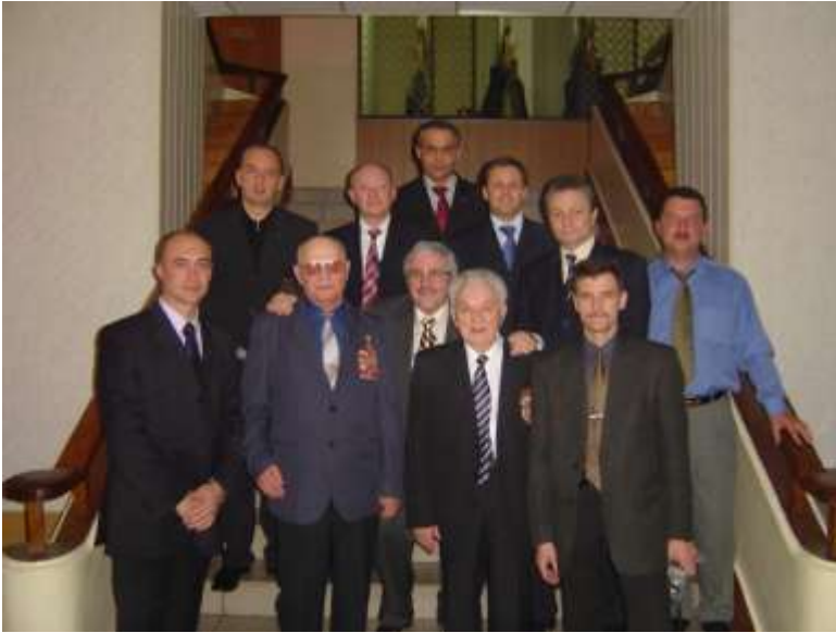
Кафедра – колективний член Фонду ветеранів воєнної розвідки

Уважно ставляться до духовних потреб кафедри очільники ветеранських організацій воєнної розвідки генерали Легомінов В.І і Левченко Ю.Т.