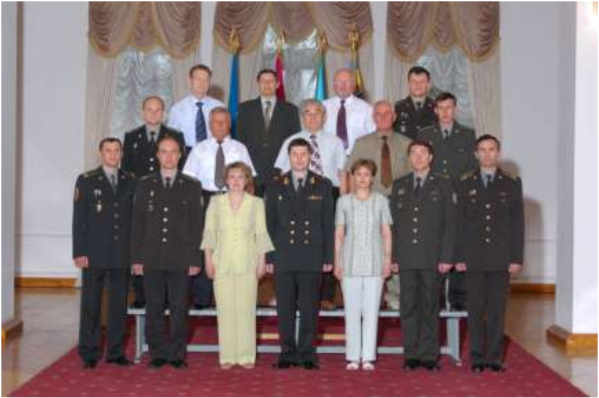
Кафедра розвідки 2006 року

Однак досвід підготовки слухачів з однорічним терміном навчання, результати їхньої діяльності у військах та відгуки безпосередніх начальників показали суттєві недоліки такого навчання. Тому з вересня 2008 року після розробки відповідних нормативних документів та навчально-методичних матеріалів академія, і кафедра у тому числі, повернулися до дворічної системи підготовки фахівців оперативно-тактичного рівня.