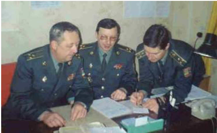
Обговорення методики проведення нового заняття

Викладачі, поряд із проведенням занять, розробляли нові лекції, навчальні посібники, командно-штабні навчання, уточнювали та коригували навчальні програми і тематичні плани.