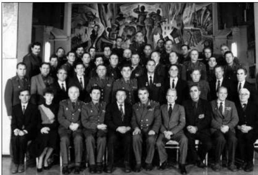
Кафедра розвідки ВА ППО СВ

Але безпосередню свою діяльність кафедра нерозривно пов'язує з підготовкою офіцерів з оперативно-стратегічною і оперативно-тактичною освітою для розвідувальних структур Збройних Сил України.